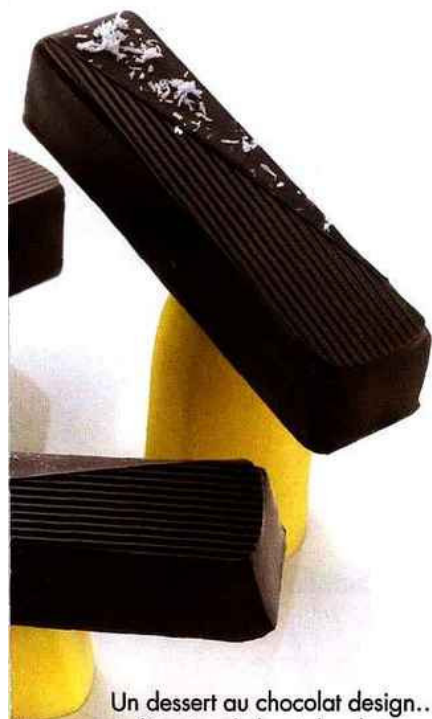
Un dessert au chocolat design... à déguster du bout des doigts. (Suggestion de présentation)